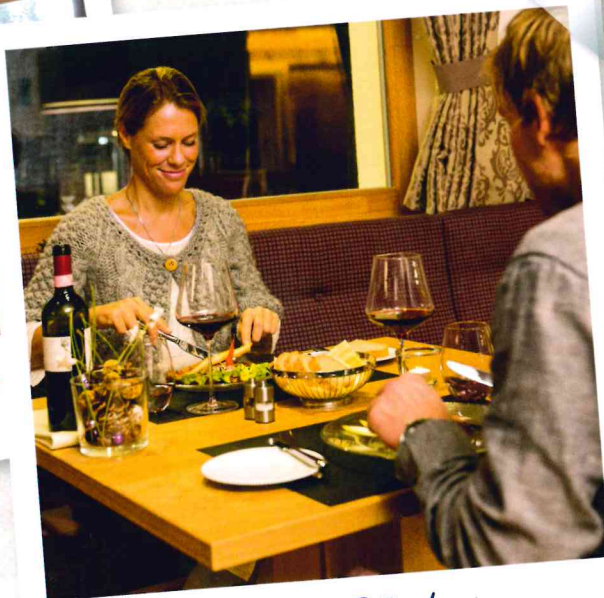
Hmmm... Bündner Spezialitäten.