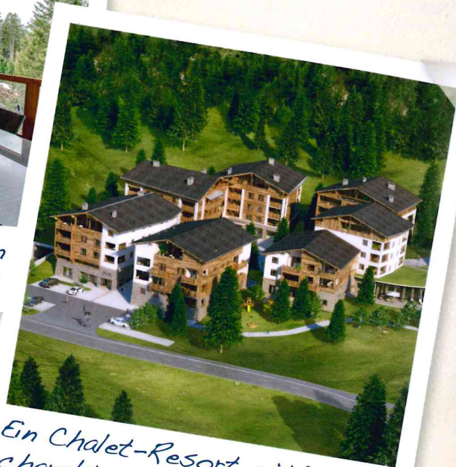
Ein Chalet-Resort mit Dorfcharakter in der Lenzerheide.

sich die Mäuler. Grüppchen-Bildung! Das Feuer lodert, die Gemüter sind erhitzt und es wird an meinem Touren-Programm herumkritisiert. Das werde ich nicht zulassen! Zum Glück kann ich meinen Freunden rund um die Lodge genügend verlockende Aktivitäten bieten. Schließlich befinden wir uns im Herzstück einer beliebten Schweizer Ferienregion. Eingebettet auf 1.500 Metern Höhe ist das sonnenverwöhnte Hochtal Lenzerheide & Valbella seit kurzem mit Arosa touristisch verbandelt. Im Winter ist es das größte zusammenhängende Skiparadies Graubündens, im Frühjahr und Sommer wird es zum Mekka für Cabrio-Fahrer, Biker und Wanderer. Neben unverfälschter Natur und Schweizer Tradition gibt es Sportgeschäfte, ein hoteleigenes Bergbad und lukrative Wellness-Angebote, die meine Cabrio-Fans begeistern werden. Außerdem locken im PRIVÀ kulinarische Genüsse für höchste Ansprüche. Und mal ehrlich: Was gibt es Schöneres nach einem ereignisreichen Tag, als den Abend in der Chalet-Sauna oder in der Lodge-Gastronomie bei einem feinen Essen mit regionaler Küche ausklingen zu lassen? Am nächsten Morgen kommt vom Chef eigenhändig frisch gebackenes Brot auf den Frühstückstisch. Alternative: Man belegt sich seine Brötchen selbst und bäckt und brutzelt in der Gruppe und tut, als wäre man daheim,